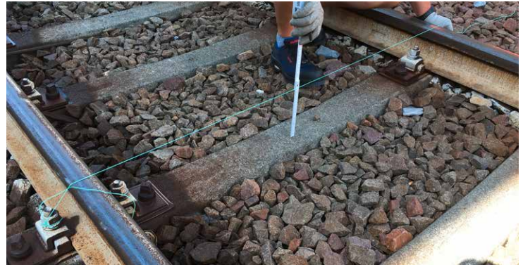
Kontrollmaß beschreibt Abstand von Schienenoberkante zu Schwellenoberkante.

Für die Angabe aller Maße beiliegende Skizze verwenden.